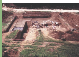
4 - Loupiac, Combe Fages - Combe Nègre