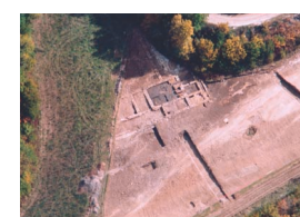
7 - Sènièrgue, Pech Piélat