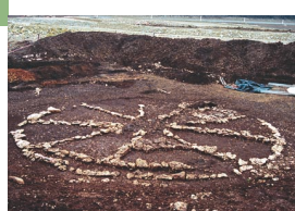
21 - Flaujac-Poujols, Camp de l'Église nord