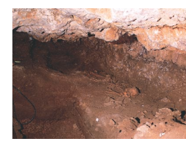
6 - Loupiac, Pech Guiton

Une telle activité archéologique dans le département se devait ensuite d'être diffusée auprès d'un large public. Le Conseil général a alors souhaité, dans le cadre de la mise en place d'un schéma de conservation et de valorisation du patrimoine archéologique départemental, réaliser une exposition itinérante présentant quelques unes des découvertes réalisées.