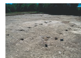
9 - Montfaucon, Travers de Saint-Hilaire