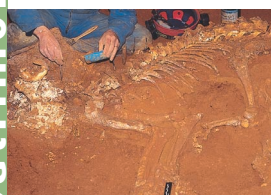
1 - Souillac, Aven du Lion