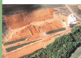
17 - Lamadelaine, Les Bosses