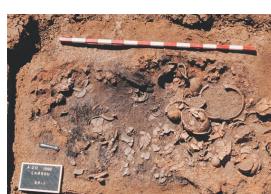
32 - Réalville, Larsou