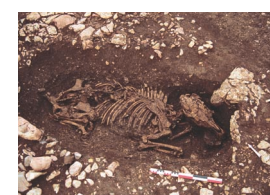
21 - Flaujac-Poujols, Camp de l'Église nord