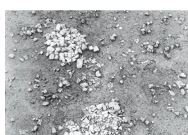
25 - Fontanes, Al Poux